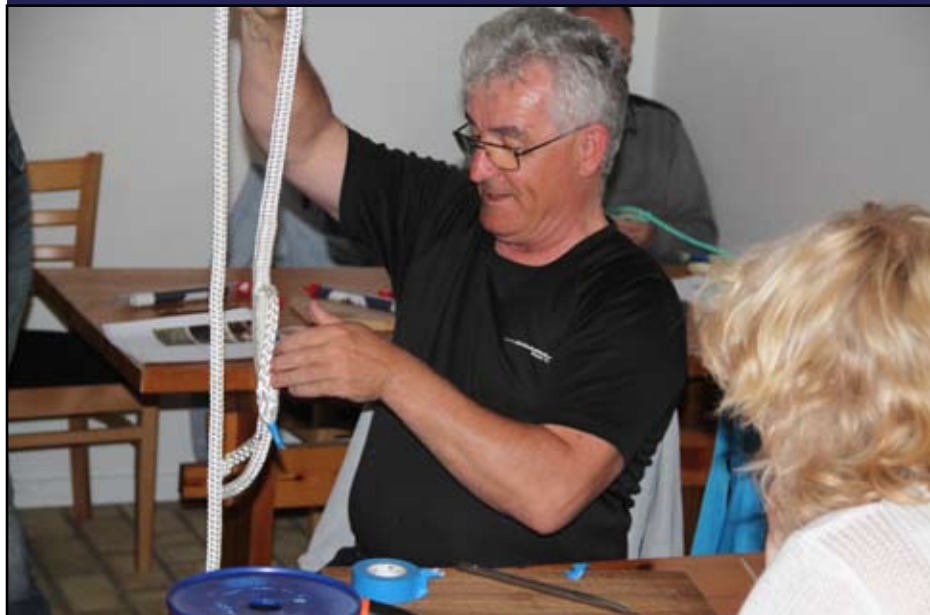
Kan splejsningen godkendes?

Nu kan vi næsten "binde knuder på os selv".