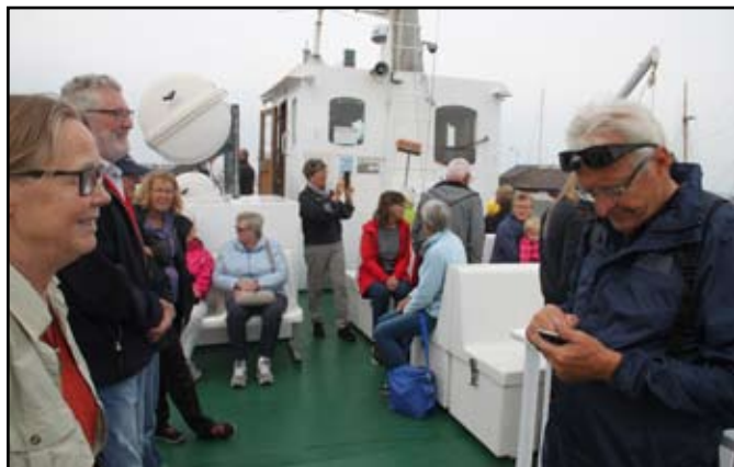
Sejlerne på færgetur