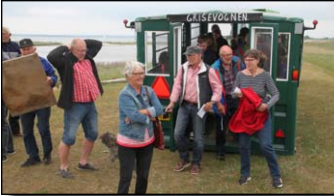
Fin transport på Bågø