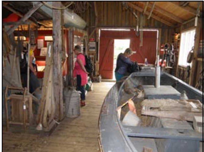
God tid til sightseing

at alle var oppe og se Danmarks mindste kirke, som lige var blevet istandsat. Planen var, at vi skulle til Lemvig og Thyborøn, men på skippermødet blev det enstemmigt