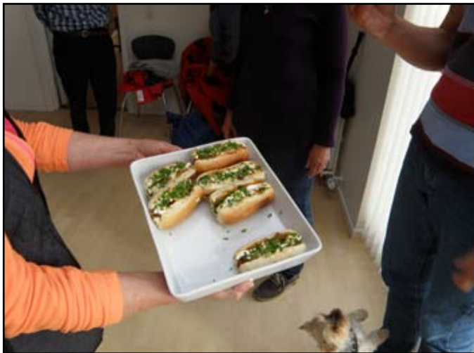
Specialitet fra Løgstør

som bestod af muslinger, chilli, mayonnaise og purløg i et pølsebrød. Dertil blev der serveret dildsnaps. Meget specielt, men det smagte ikke så ringe. Selv om vejret ikke var det bed-