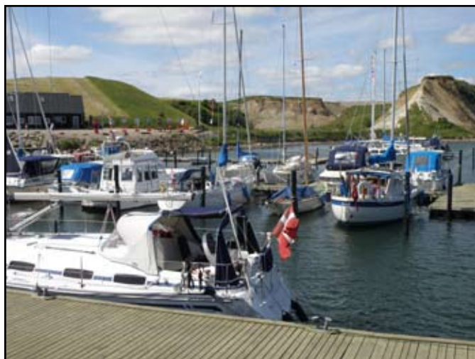
God plads i havnene

vedtaget at springe de to byer over p.g.a. det meget ustadige vejr. Nissum bredning kan meget nemt vise tænder, og vi var jo på tur for at have det rart og undgå de ubehagelige sejladser. Efter Venø skulle vi til Doverodde, men havnen var næsten lukket p.g.a. ombygning, så alle sejlede direkte til Thisted, og vejmeldingen lovede endnu engang kuling.