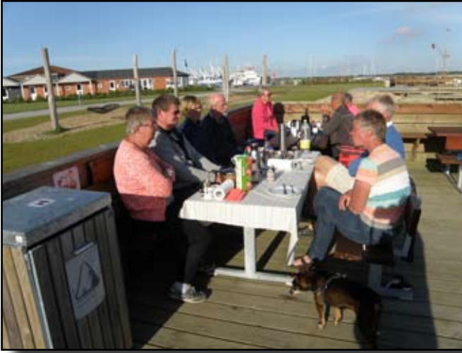
Aften på Fur

formiddagen. Efter frokost sejlede vi videre til Nykøbing Mors. Denne gang var der næsten ingen vind, men vi nød det gode vejr, og så måtte det jo tage den tid, det tog. Næste dag blev også en "overligger dag" med kraftig vind. Lørdag var der igen blevet vejr til at komme på vandet, så kursen blev sat mod Struer. Der blæste mere end de 7-9 m/s, som der var meldt, men heldigvis var vinden i n/v, og bølgerne gik på tværs af fjorden. Solskin, men kun 16 grader, men