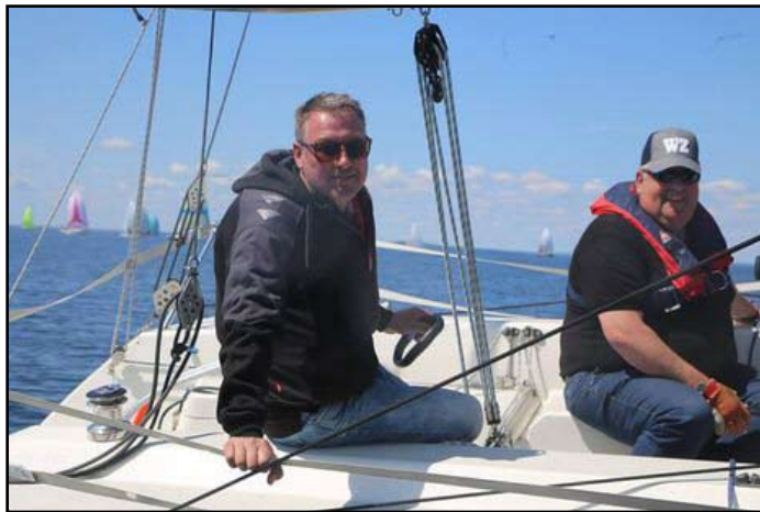
Båden sejler som regel fra en X-99.

har vi fået en stor kappe i storsejlet", lyder forklaringen fra skipperen, der sidste år købte nyt storsejl og fok i eksklusiv laminatdug, 4T Forte, fra OneSails i Helsingør. En