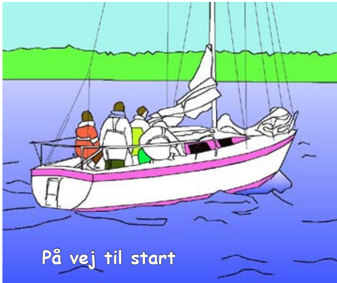
På vej til start